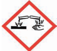
Korozif (aşındırıcı) madde